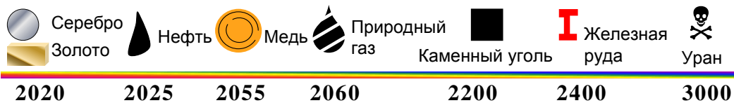
Рис. 3. Ограниченность запасов полезных ископаемых

Все природные ресурсы можно разделить, т.е. классифицировать на исчерпаемые и неисчерпаемые , возобновляемые и невозобновляемые , заменяемые и незаменяемые . Промышленное производство мира в период с 1860 по 2000 г. увеличилось в 140 раз, что привело к резкому увеличению потребления всех видов природных ресурсов на Земном шаре.