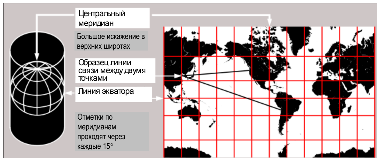
Рис. 2. Географическая проекция

Социальные ориентиры. Алтари и часовни православных и лютеранских церквей обращены на восток, алтари католических церквей — на запад, буддийские пагоды обращены фасадами на юг.